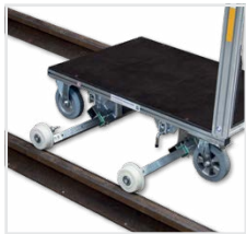
Abb. Schienensystem Bestell-Nr. 120200 mit montiert an Universal-Rollcontainer Bestell-Nr. 120001