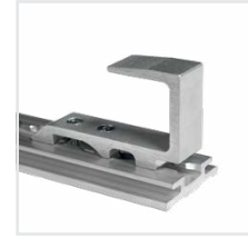
Abb. Bestell-Nr. 120111 und Bestell-Nr. 120100