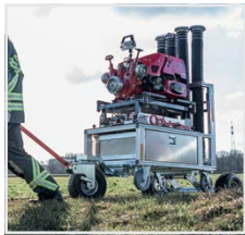
Abb. Off-Road-System Bestell-Nr. 120250 montiert an Rollcontainer Bestell-Nr. 120008