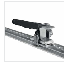
Abb. Bestell-Nr. 120103 und Bestell-Nr. 20100

Hinweis: Eine individuelle Beklebung der Rollcontainer ist auf Anfrage möglich. Unsere Markierungs-Sets finden Sie online unter www.munk-rettungstechnik.de