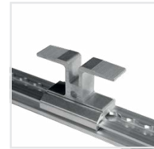
Abb. Bestell-Nr. 120112 und Bestell-Nr. 120100